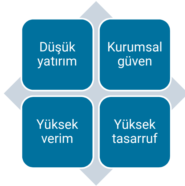
Şekil 4-Bütünleşik faks yönetimi platformunun avantajları